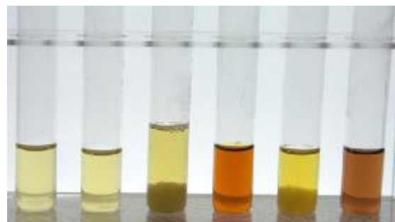
Abb. 2: im gekochten Zustand

Die Ergebnisse werden ausgewertet und zusammengetragen. Der entscheidende Teil ist nach der Analyse die Synthese. D. h. die Ergebnisse und die bekannten Symptome in ein Gesamtbild und eine Gesamtdiagnose einzuordnen. Dies ermöglicht dann dem Therapeuten, die Therapie und die Medikamente zusammenzustellen.