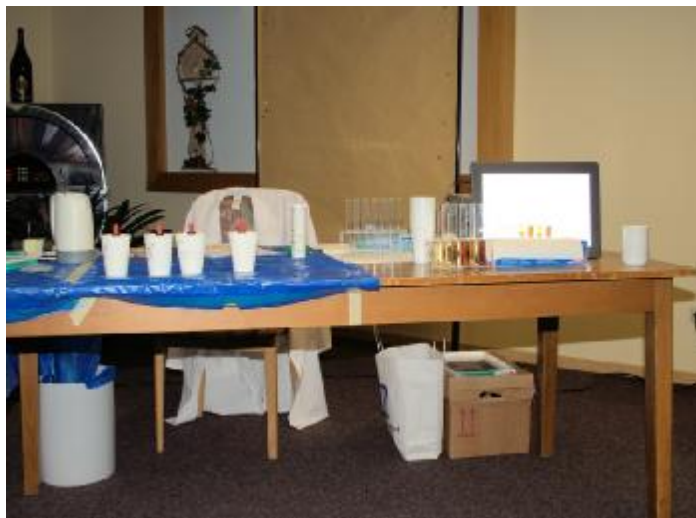
Abb. 4: das 'Mini-Labor'

Hier ein Blick auf das ‚Mini-Labor‘, mit bzw. an dem wir gearbeitet haben: